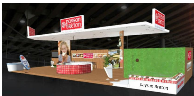
Projet en 3D du stand Paysan Breton

Bien évidemment, des dégustations seront aussi proposées pendant la durée du salon.