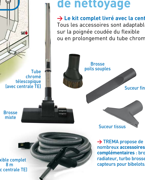
Tube chromé télescopique (avec centrale TE)

Tous les accessoires sont adaptables sur la poignée coudée du flexible ou en prolongement du tube chromé.